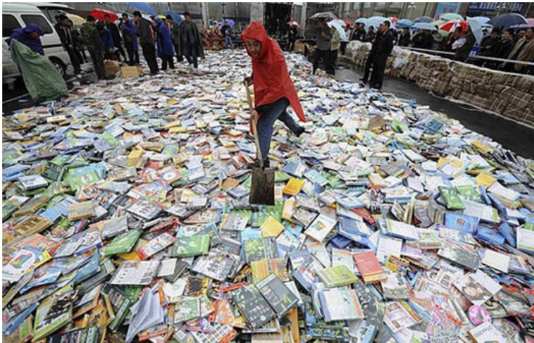
Shoveling pirated DVDs in Taiyuan, Shanxi province, China, April 20, 2008.

pensas. Propagan placer o amenazas de muerte, teorías conspirativas o contrabando, resistencia o paralización. Las imágenes pobres muestran lo extraño, lo obvio y lo increíble, mientras seamos aún capaces de descifrarlas.