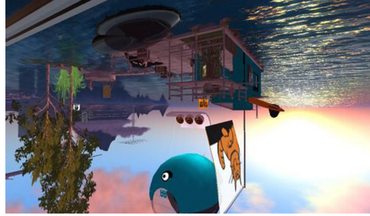
Chris Marker's virtual home on Second Life, May 29, 2009.